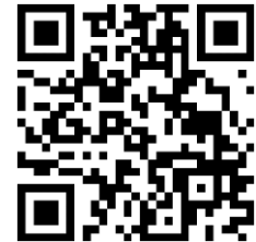
QR code แผนที่ ศพก.