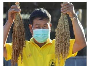
ภาพประธาน ศพก.